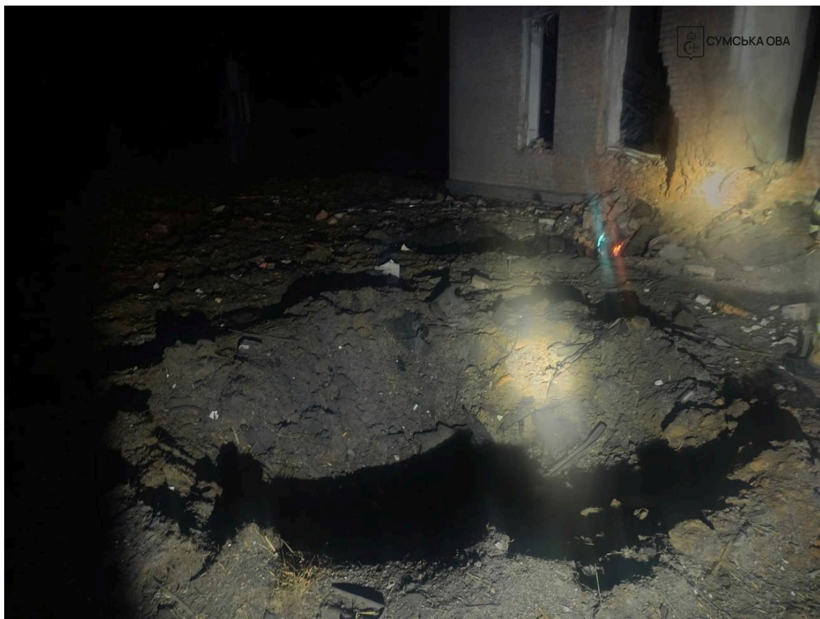
Фото: наслідки ворожої атаки на Сумщині

"Вбивчі ворожі удари по залізничній інфраструктурі Сумщини продовжились цієї ночі. Ворог спрямував шахеди на станції, вокзали, пости електричної сигналізації, підстанції", - написав він.