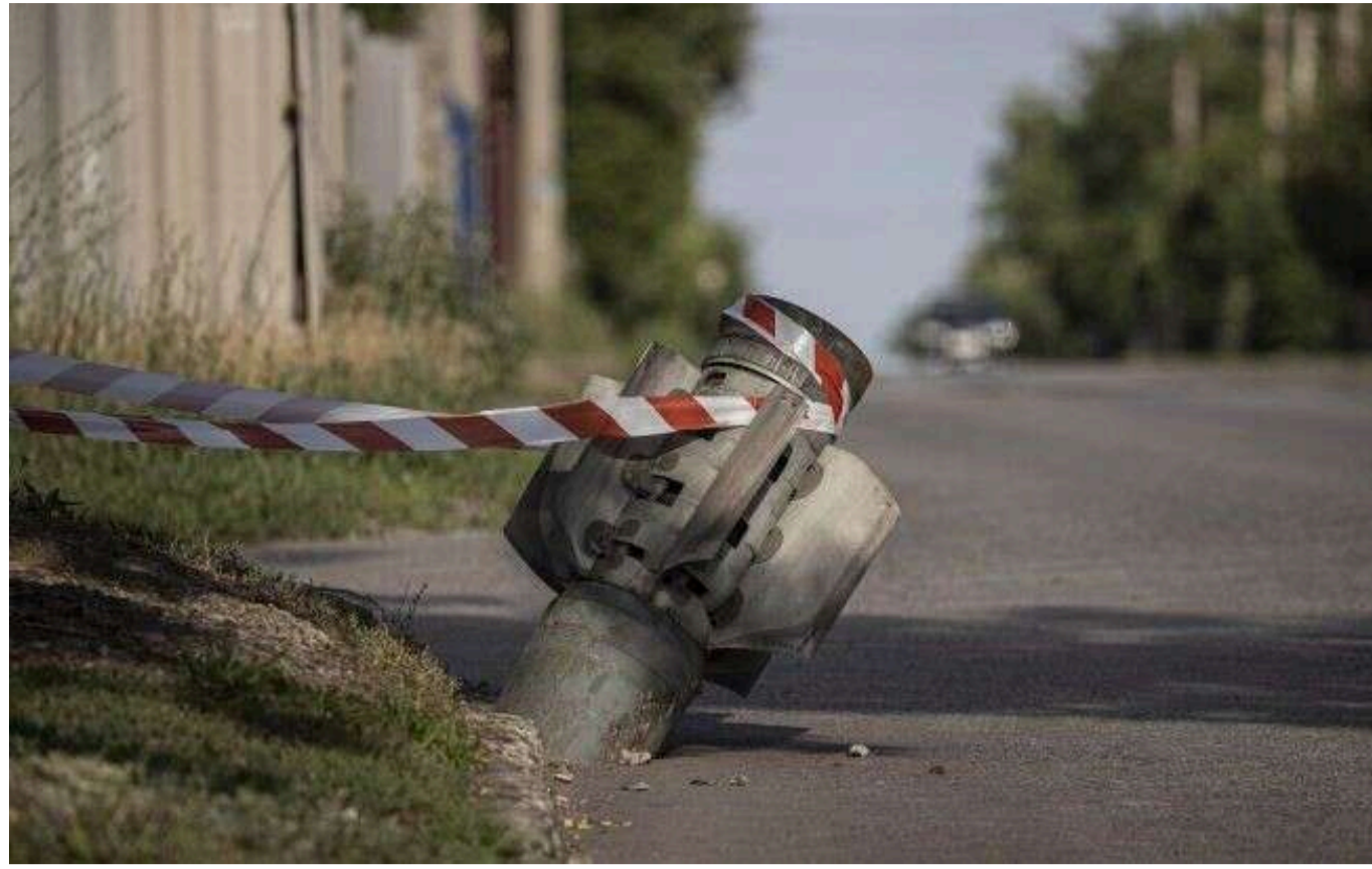
Вранці ЗС РФ атакували Нікопольський район артилерією та дронами

Читати на руськом Read in English Додати як бажане джерело в Google