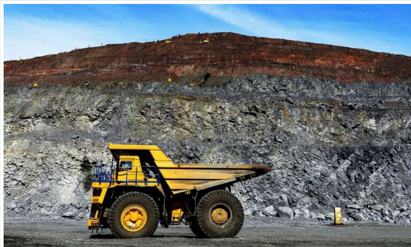
Криворізький залізорудний комбінат на межі банкрутства: суд відкрив провадження, борги за електроенергію - понад 150 мільйонів гривень