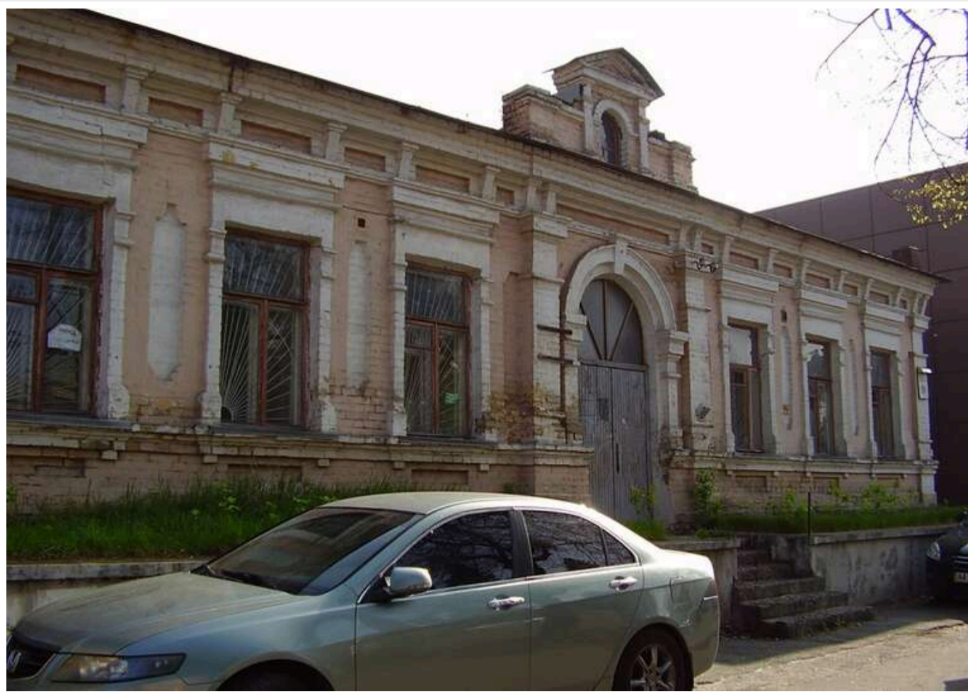
Незважаючи на заборону, забудовник хоче вбудувати бізнес-центр в особняк Баккалинського в Києві

Власник програв суд за судом, проте не відступає і намагається скасувати охоронний статус об'єкта, тому боротьба за історичну будівлю продовжується.