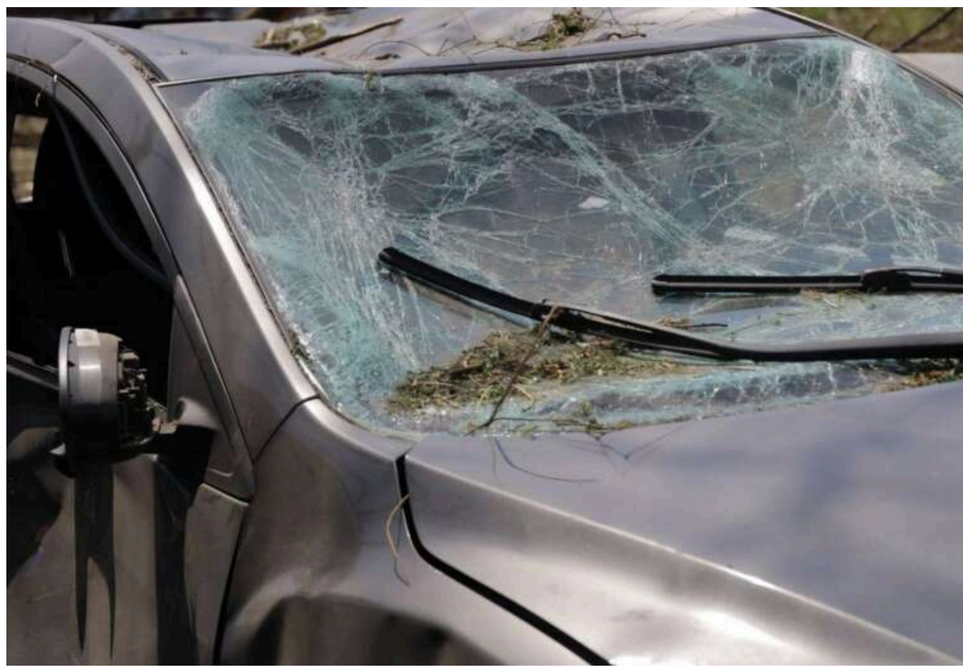
У Самарі на Дніпропетровщині внаслідок ракетної атаки є загиблі та поранені

Після ракетної атаки на місто Самар у Дніпропетровській області зафіксовано загиблих і поранених, повідомляє обласна військова адміністрація.