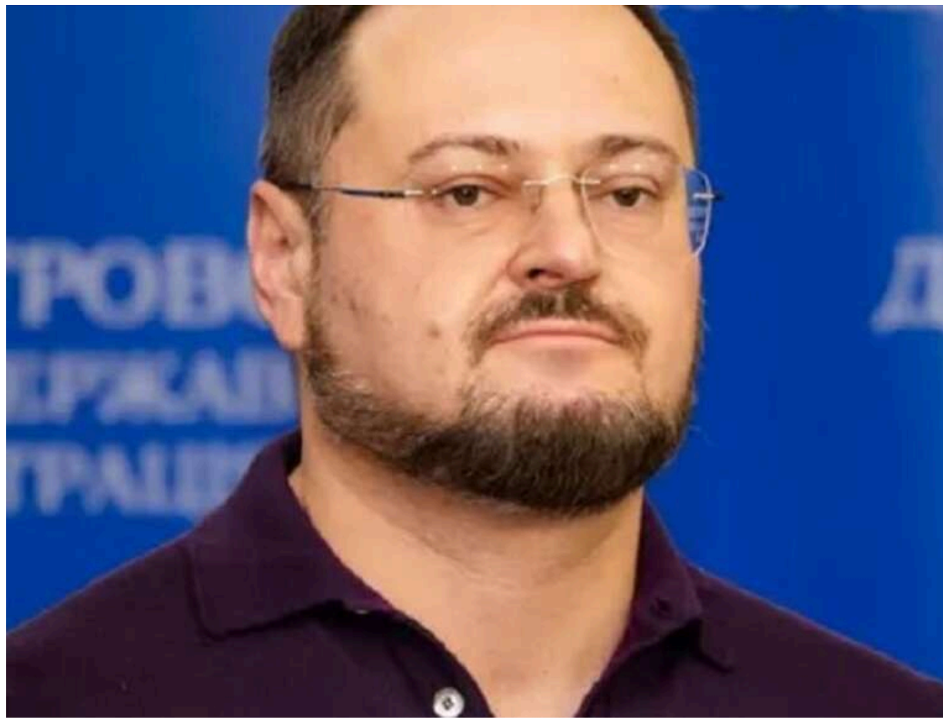
Система Біжка: як обласний прокурор перетворив службу на бізнес-імперію

Керівник Дніпропетровської обласної прокуратури Сергій Біжка, який у 46 років отримав пенсію за інвалідністю під час війни, продовжує вести активне життя, будувати родинний бізнес і призначати на посади друзів і кумів.