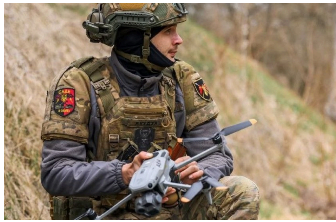
Повномасштабна війна триває з 24 лютого 2022 року

ЗСУ за останню добу ліквідували 1300 російських окупантів. Загальні втрати особового складу російської армії РФ на 1570 добу повномасштабної війни становлять 1 380 120 осіб.