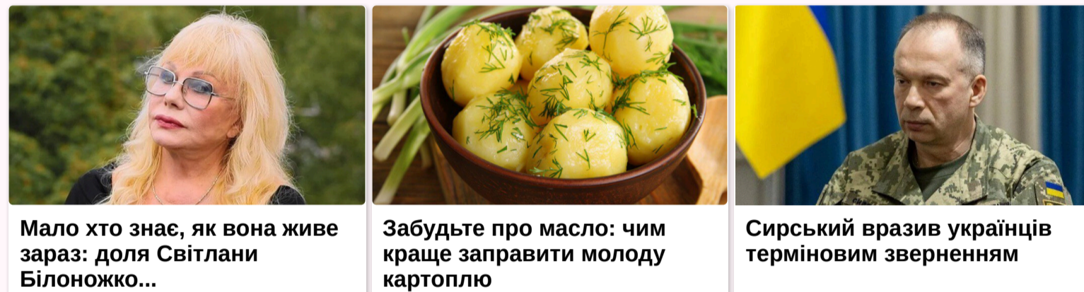
Мало хто знає, як вона живе зараз: доля Світлани Білоножко...