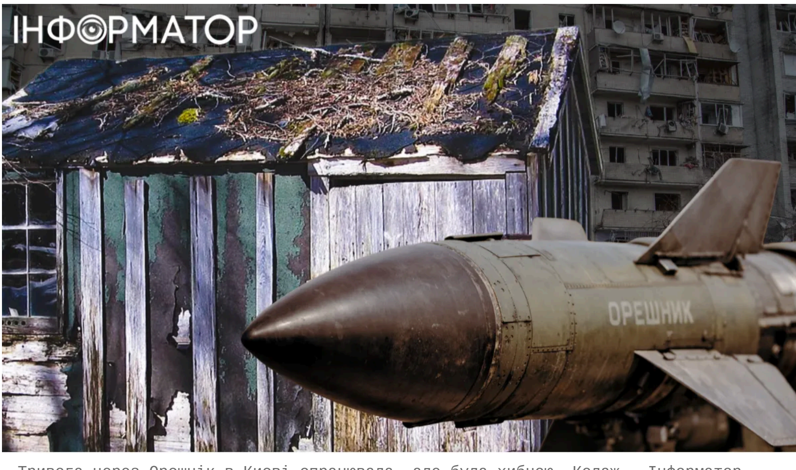
Тривога через Орешнік в Києві спрацювала, але була хибною. Колаж - Інформатор-Україна

Уночі 11 червня по всій Україні оголосили повітряну тривогу - моніторингові канали зафіксували загрозу пуску балістичної ракети з полігону Капустин Яр. Лише кілька тижнів тому стався третій удар "Орешніком" по Київщині , тому нова загроза змусила українців знову йти в укриття. Тривогу оголосили о 23:29, а вже о 23:43 пролунав відбій.