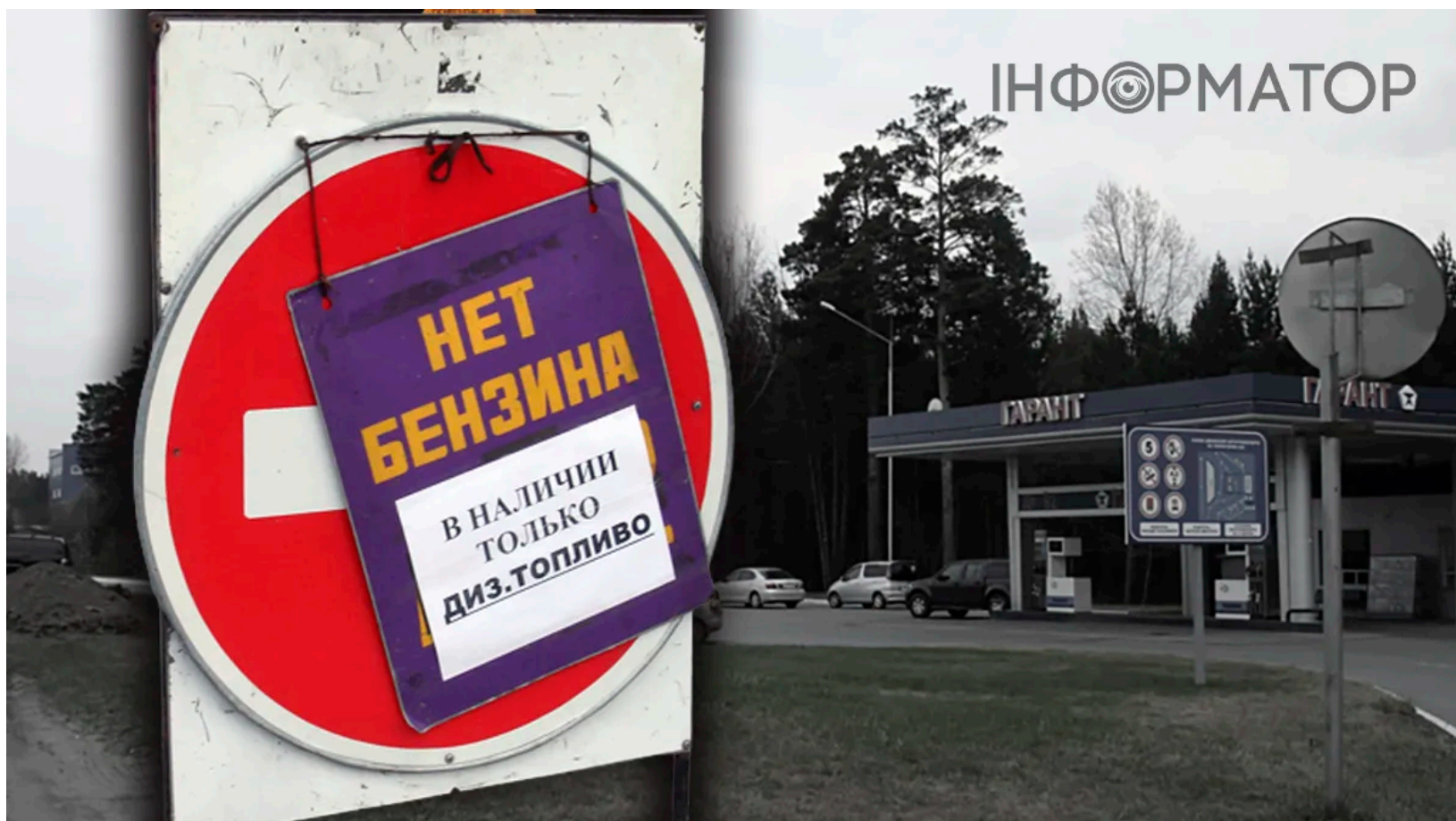
Паливна криза в Росії

Паливна криза в Росії вийшла далеко за межі прикордонних регіонів і охопила всю країну - від Москви до Іркутська і Владивостока. Обмеження на купівлю бензину запровадили щонайменше в 15 регіонах, включно зі столицею та Санкт-Петербургом, а також на тимчасово окупованих українських територіях. Черги на заправках, порожні баки і нові ліміти - такою є картина Росії станом на середину червня. Причиною стали успішні атаки Збройних сил України по нафтопереробних заводах.