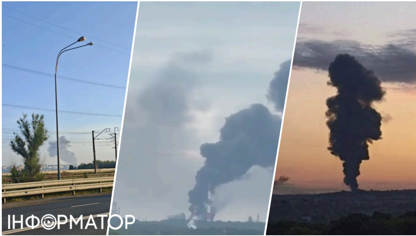
Дрони атакували хімізавод РФ і окупований Крим

Після атаки безпілотників у кількох регіонах Росії та в тимчасово окупованому Криму повідомили про пожежі й наслідки для інфраструктури. У ніч на 12 червня у Тольятті загорівся один із найбільших нафтохімічних заводів країни. У Нижньокамську над містом помітили густий дим , а в Сімферополі виникла пожежа та почалися перебої з електропостачанням. Попередньо, під удар могли потрапити об'єкти енергетичної та хімічної галузей.