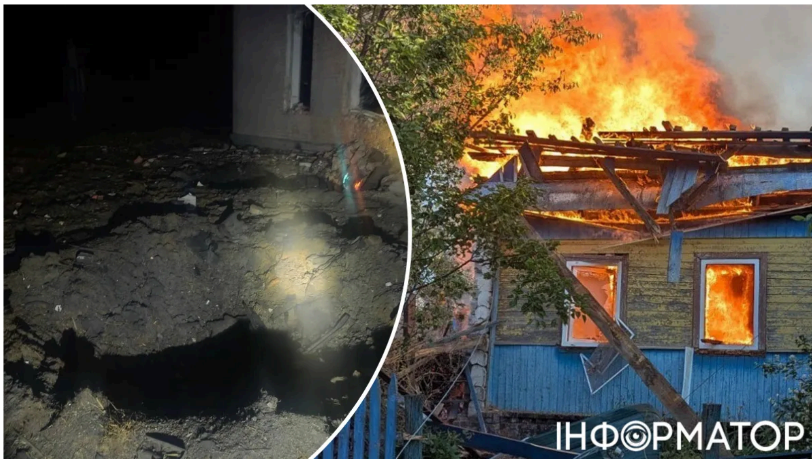
Дрон РФ вдарив по Шосткинській громаді

Російський безпілотною атакував цивільну інфраструктуру Шосткинської громади на Сумщині у ніч на 12 червня. Внаслідок удару загинула 44-річна працівниця одного з об'єктів залізниці. Ще одна жінка, 33 роки, отримала важкі травми і зараз перебуває під медичною опікою. Значних руйнувань зазнала триповерхова нежитлова будівля, обставини та повні наслідки атаки уточнюються.