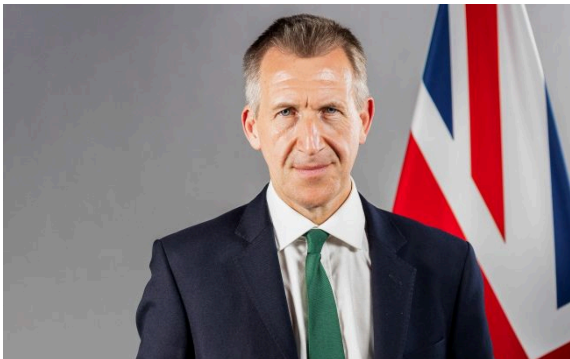
Фото: міністр оборони Великої Британії Ден Джарвіс (Вікімедіа)