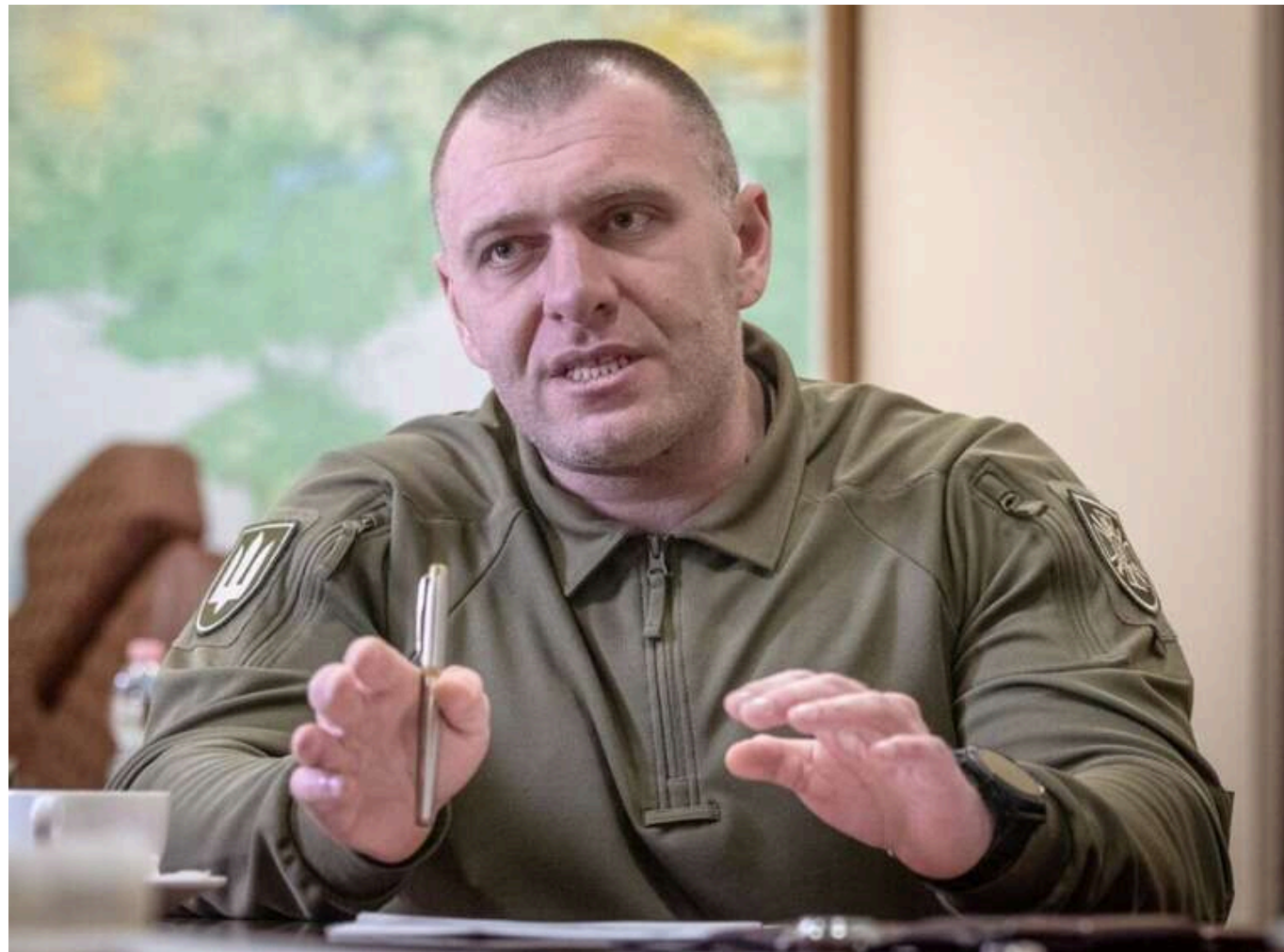
Telegram-канал, близький до ОП, звинуватив голову СБУ Василя Малюка в дискредитації Володимира Зеленського та Андрія Єрмака

Читати на руськом Read in English Додати як бажане джерело в Google