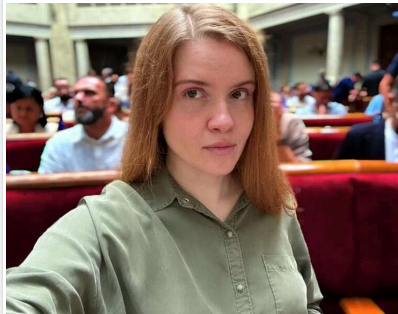
Нардепка Мар'яна Безугла розкритикувала колег із комітету ВР, назвавши їх «хом'ячками»

Народна депутатка Мар'яна Безугла, яка раніше обіймала посаду заступниці голови комітету Верховної Ради з питань національної безпеки, оборони та розвідки, розкритикувала своїх колишніх колег.