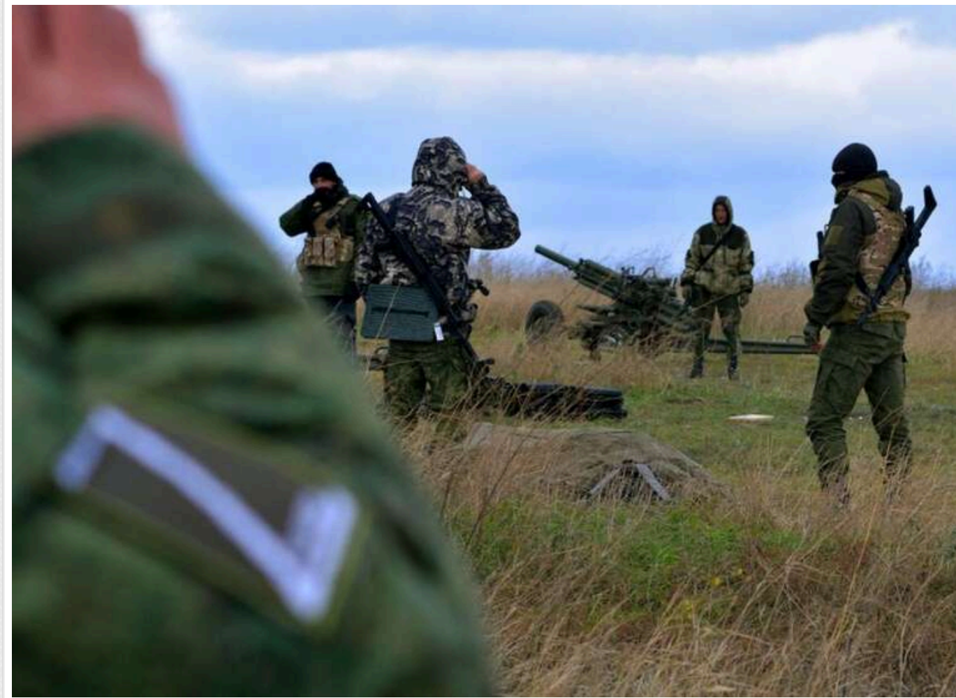
Росія у фінансовій кризі й потребує «перемоги», щоб вийти з війни, - Резніков

Читати на руском Read in English Додати як бажане джерело в Google