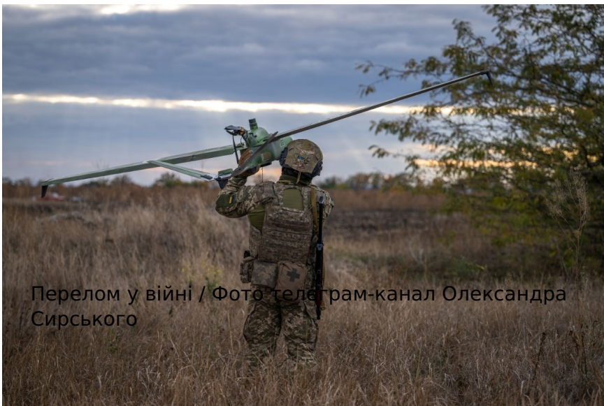
Перелом у війні

https://www.facebook.com/sharer/sharer.php?u=https://24tv.ua/perelom-viyni-za-6-misyatsiv-vid-chogo-vin-zalezhit_n3085924 ) ( https://twitter.com/intent/tweet?text=Чи можливий перелом у війні за пів року: військовий оглядач сказав, від чого це залежатимеhttps://24tv.ua/perelom-viyni-za-6-misyatsiv-vid-chogo-vin-zalezhit_n3085924 ) ( https://t.me/share/url?url=https://24tv.ua/perelom-viyni-za-6-misyatsiv-vid-chogo-vin-zalezhit_n3085924 ) ( viber://forward?text=https://24tv.ua/perelom-viyni-za-6-misyatsiv-vid-chogo-vin-zalezhit_n3085924 )