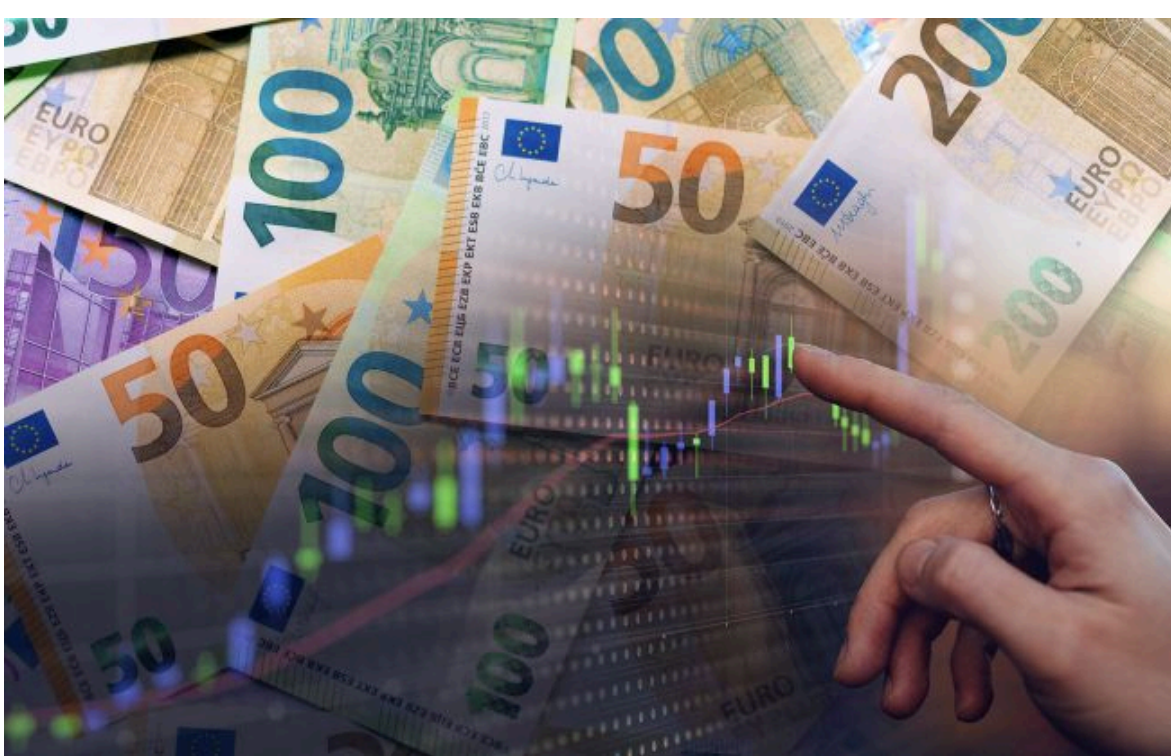
Фото: євро та рейтинг фінансів (колаж РБК-Україна)