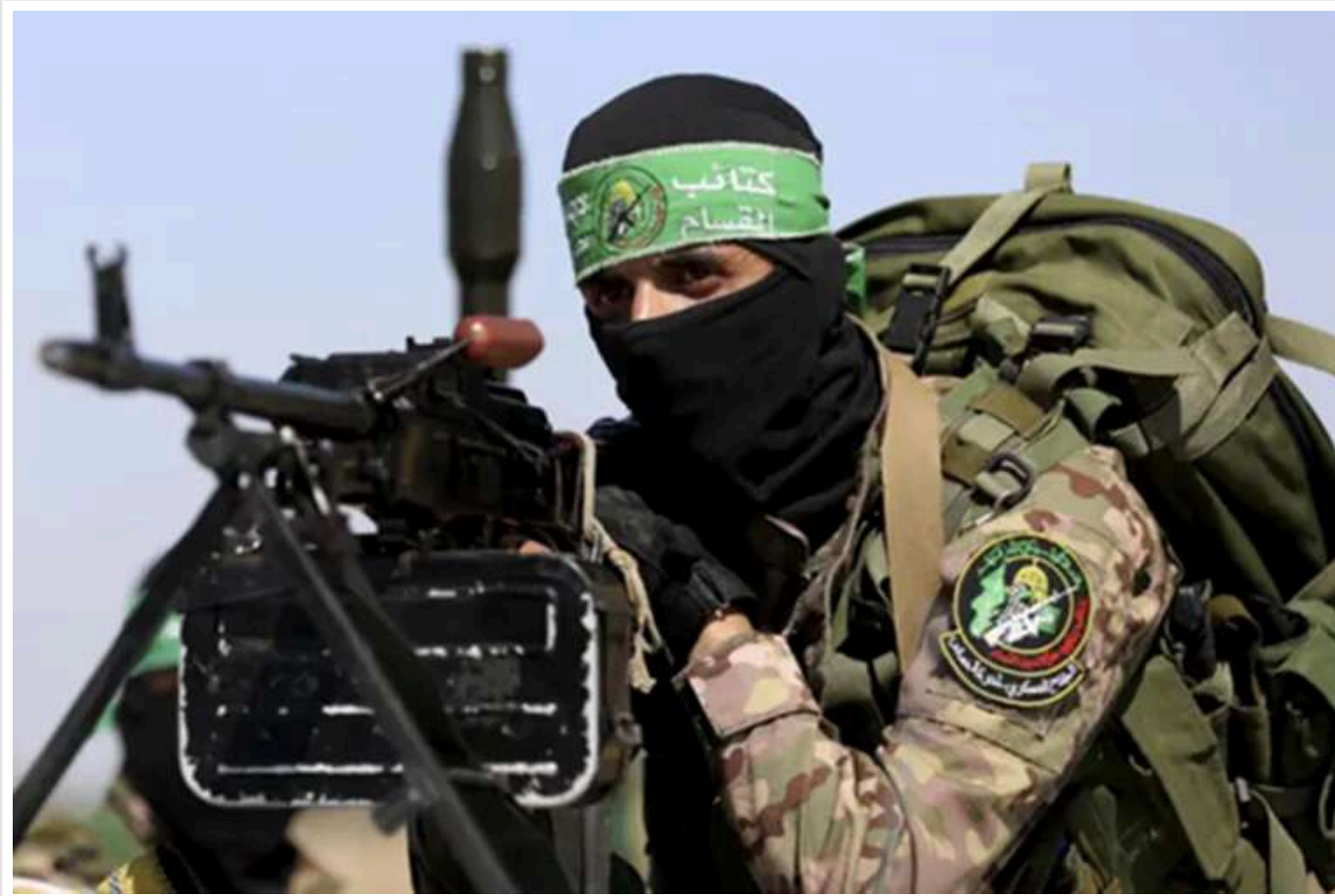
У ЦАХАЛ повідомили про ліквідацію фінансового керівника ХАМАС

У ЦАХАЛ повідомили, що під час спільної операції з ШАБАК у центральному районі Гази було ліквідовано Ібрагіма Абу-Шамалу, високопоставленого члена угруповання ХАМАС. Він обіймав посаду фінансового директора військового крила ХАМАС і був помічником заступника командувача військового крила угруповання.