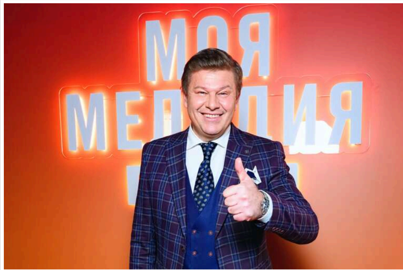
Російський пропагандист Губернієв повідомив про грандіозну катастрофу в біатлоні РФ: "Ось такі помідори"

Читати на руськом Додати як бажане джерело в Google