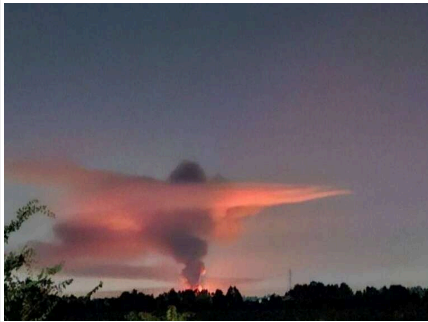
Ізраїль уночі завдав серії ударів по цілях у Тегерані, зокрема по об'єктах військової та ядерної інфраструктури

Армія оборони Ізраїлю (ЦАХАЛ) повідомила про масштабну операцію проти стратегічних об'єктів в Ірані. За офіційними даними, у нальоті взяли участь понад 60 винищувачів, які випустили близько 120 боєприпасів.