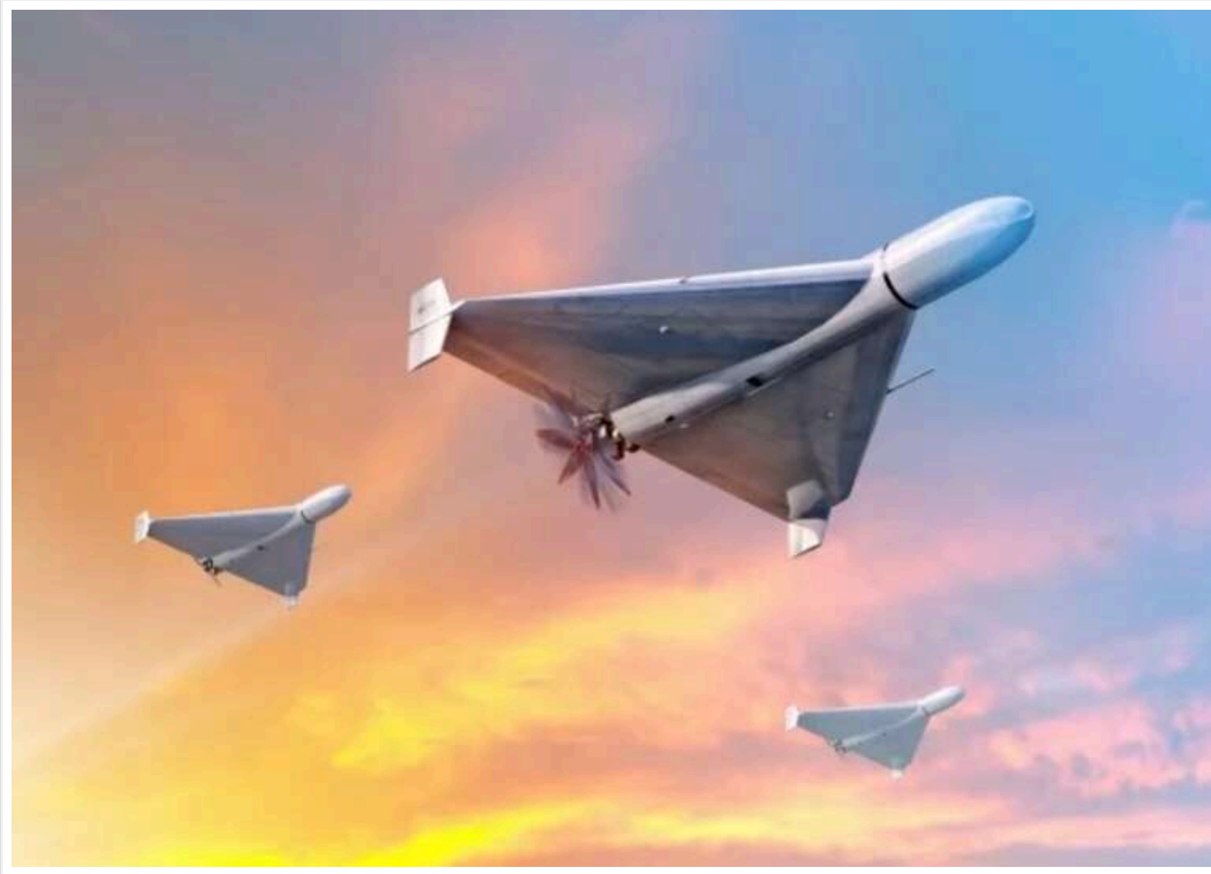
Росія готує нову хвилю ройових атак дронами та інформаційний тиск, – Коваленко

Росія планує інтенсифікувати терор українських міст за допомогою масованих атак дронами, паралельно ведучи агресивну інформаційну кампанію як на зовнішню, так і на внутрішню аудиторію.