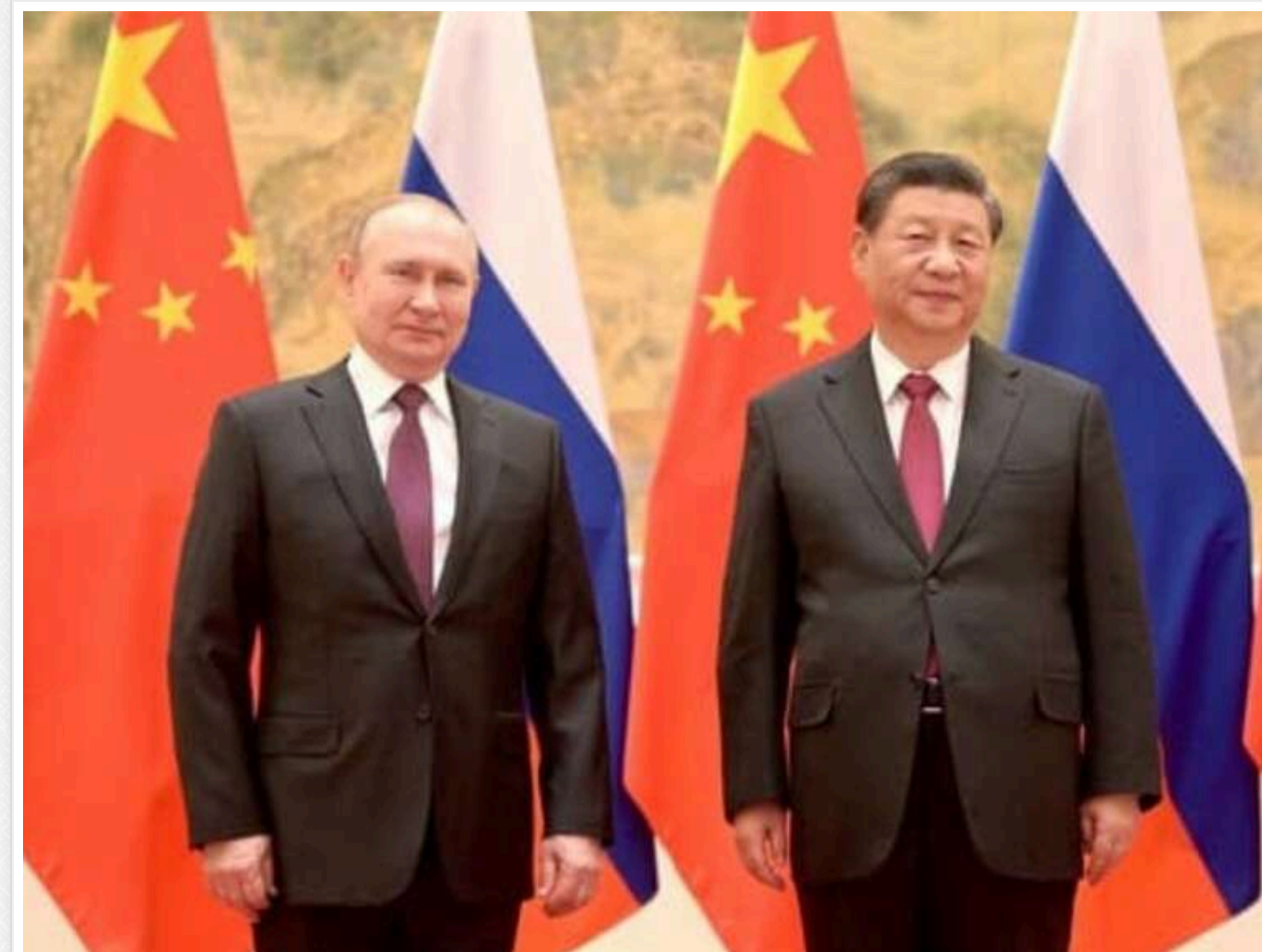
Китай почав постачати летальну зброю до РФ, - ЗМІ