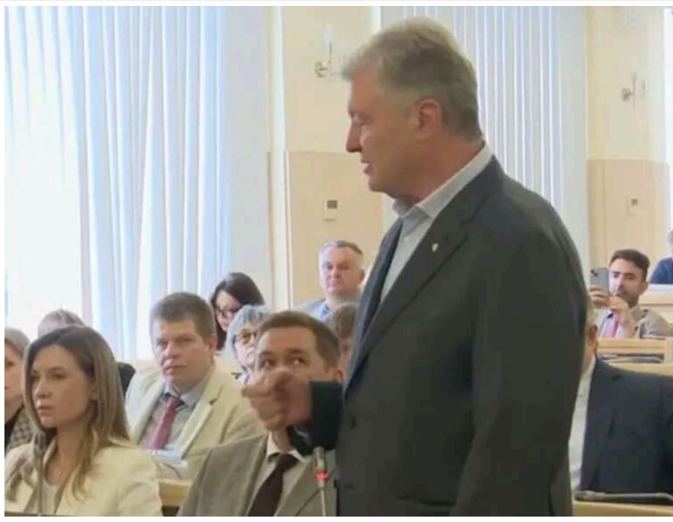
Верховний Суд розглянув позов Порошенка щодо зняття санкцій проти нього

Читати на руськом Read in English Додати як бажане джерело в Google