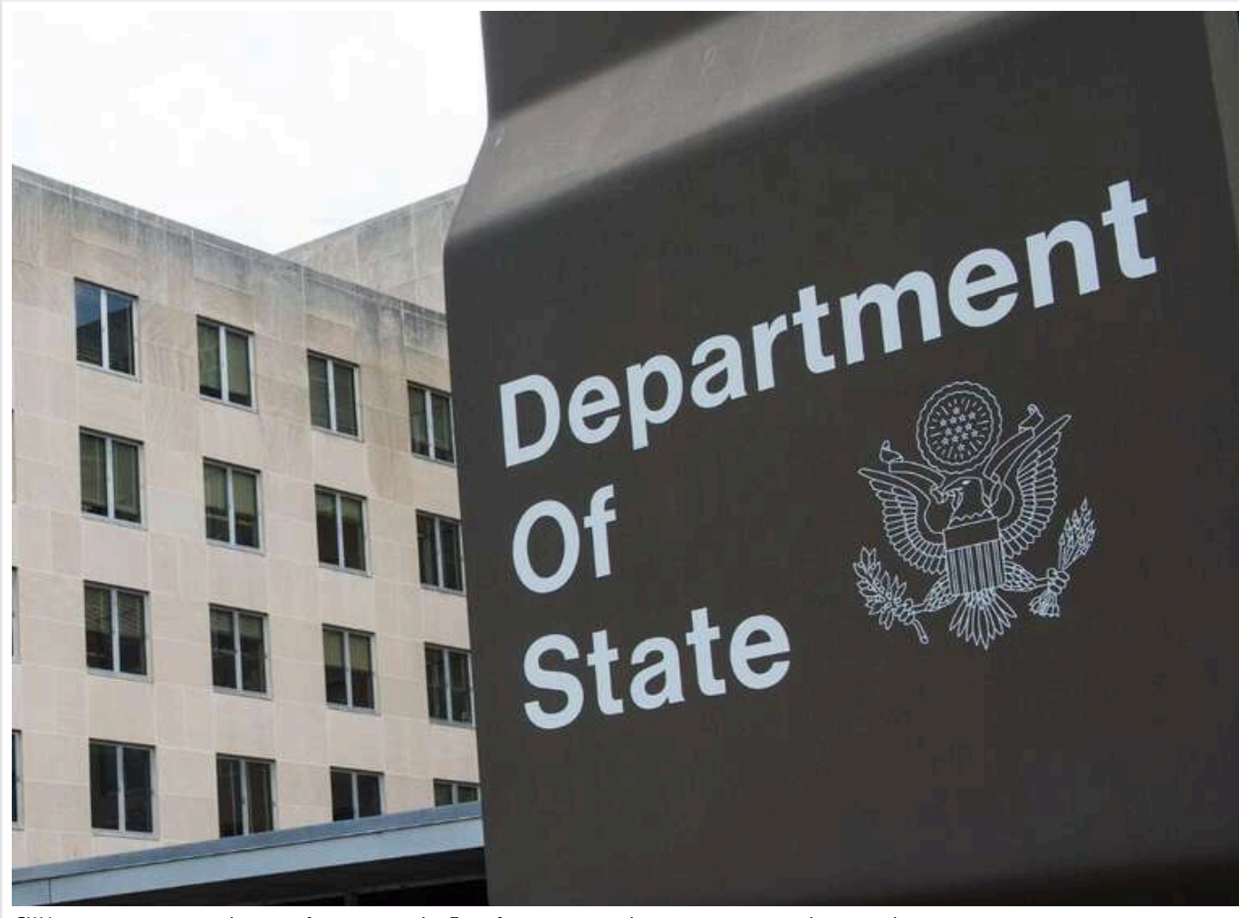
США посилюють перевірку студентських віз: Держдеп почне моніторити соцмережі заявників

Держдеп США запроваджує нові правила для студентських віз: тепер перевірятимуть соцмережі заявників, пише CNN.