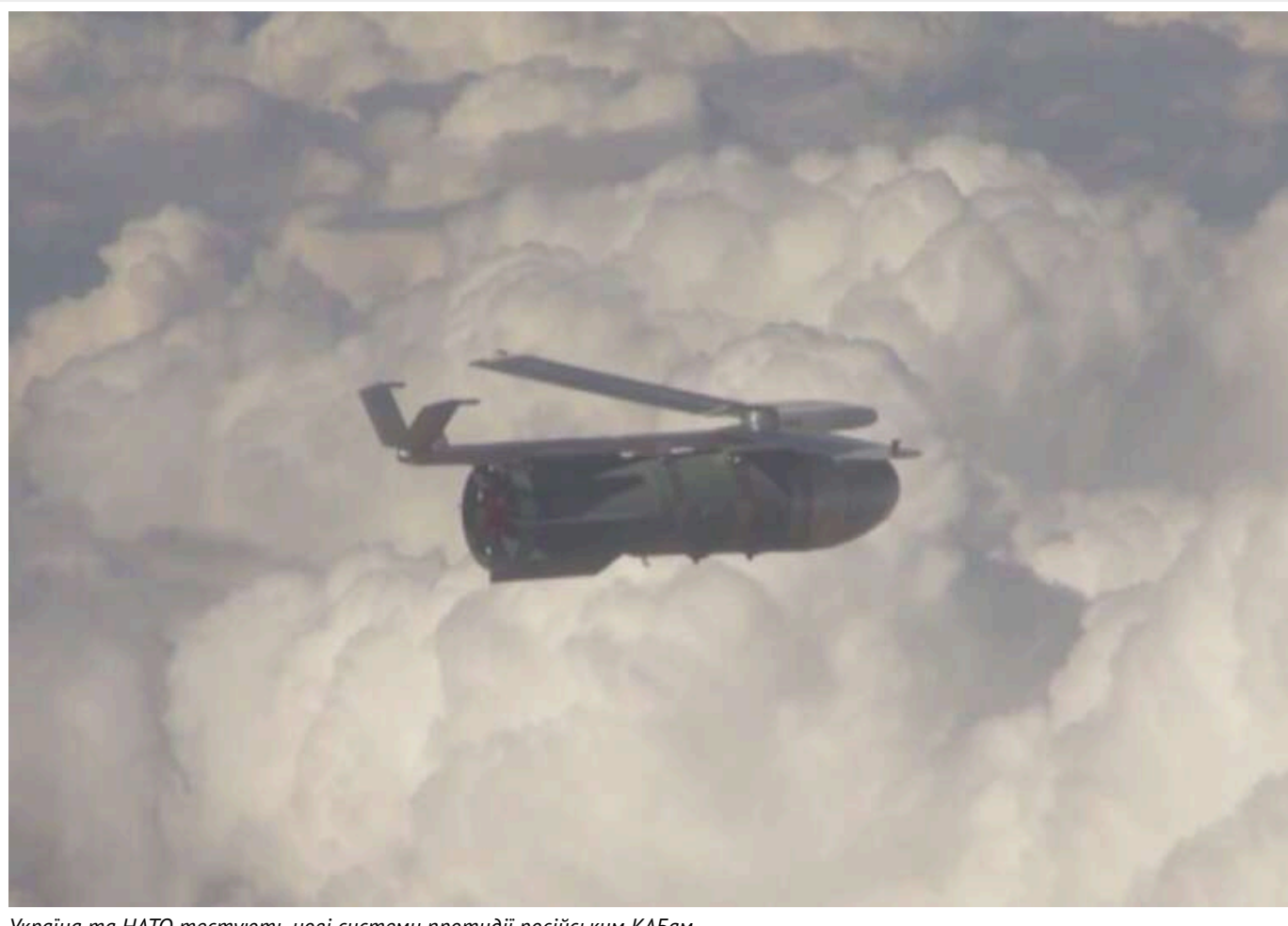
Україна та НАТО тестують нові системи протидії російським КАБам

У НАТО здійснили тестування засобів для протидії російським керованим планерівним бомбам (КАБ та ФАБ).