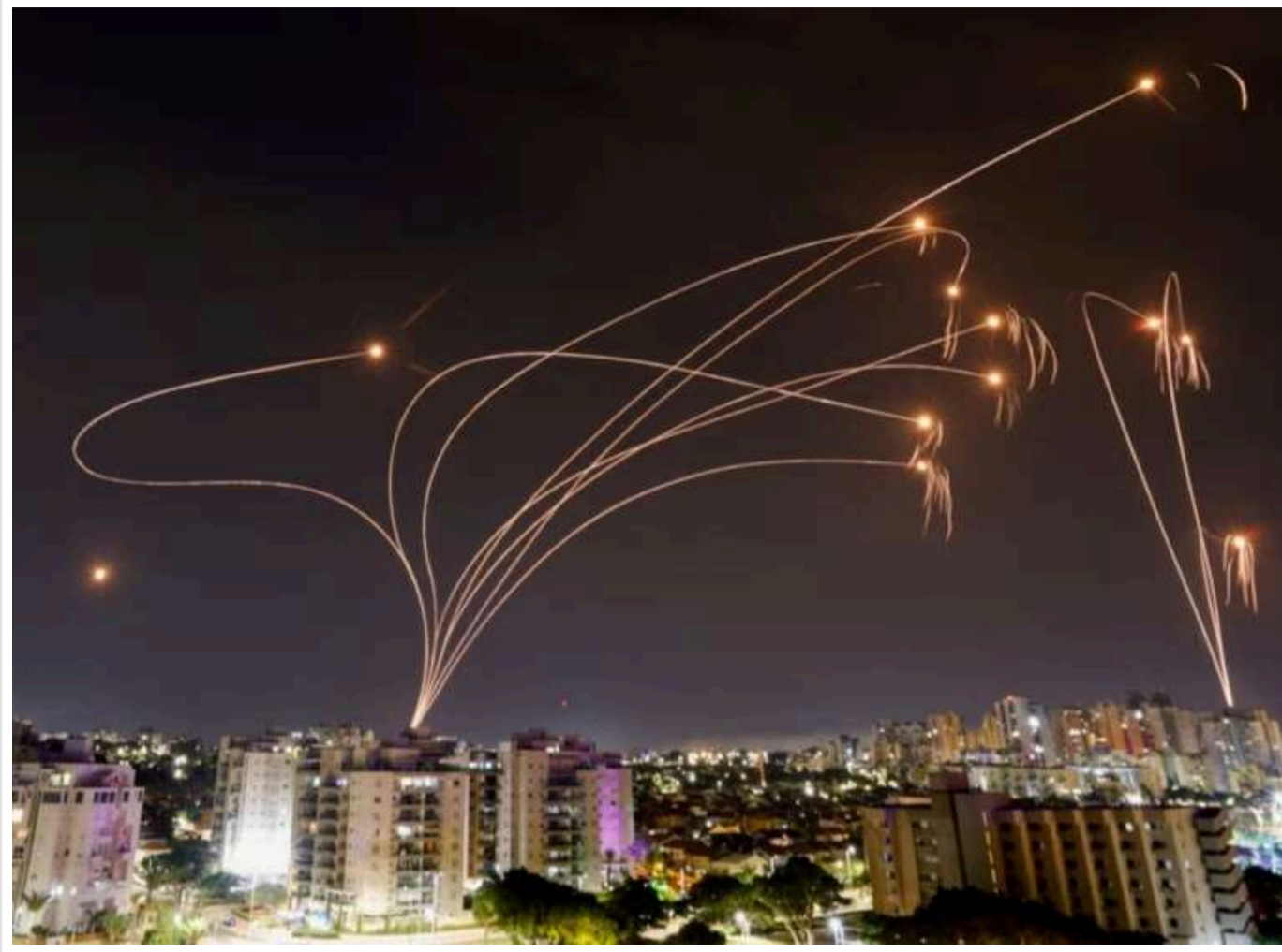
Ефективність «Залізного купола» знизилася: Ізраїль перехопив лише 65% іранських ракет – NBC

Лише 65% ракет, випущених Іраном за останні 24 години, були перехоплені системою ПРО «Залізний купол» країни, у порівнянні з майже 90% днем раніше, повідомив високопосадовець ізраїльської розвідки в інтерв'ю для NBC News.