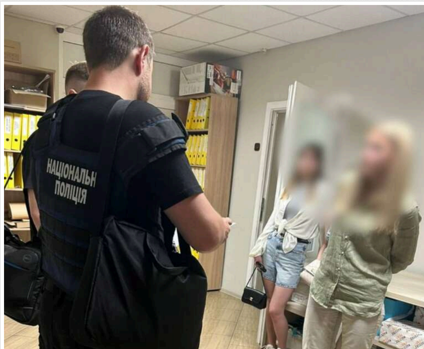
Оборудка на 240 мільйонів гривень на відбудові водогону після підриву Каховської ГЕС: поліція повідомила підозри організаторам "схеми"

Будівельна компанія отримала 7,3 млрд грн державних коштів, але замість реального виконання робіт організувала "схему".