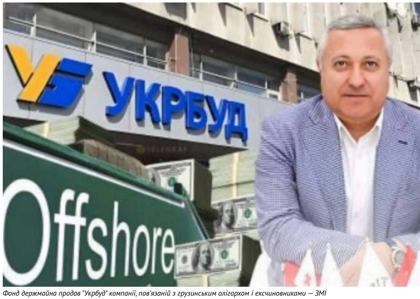
Фонд держмайна продав "Укрбуд" компанії, пов'язаній з грузинським олігархом і ексчиновниками – ЗМІ

Державний концерн «Укрбуд», до складу якого входить значна кількість нерухомості, був проданий на аукціоні всього за 805 млн гривень.