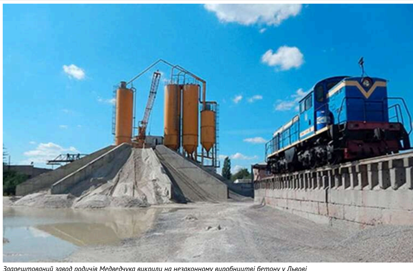
Заарештований завод родичів Медведчука викрили на незаконному виробництві бетону у Львові

Арештований завод зрадника Віктора Медведчука спіймали на незаконному використанні арештованих потужностей. Там виготовляли та продавали бетонні розчини без дозвільних документів і використовували спецтранспорт поза контролем держави. Завод має масштабну виробничу інфраструктуру з загальною вартістю майна понад 16 мільйонів гривень. Правоохоронці продовжують розслідування, щоб припинити цю діяльність і повернути активи у власність держави.