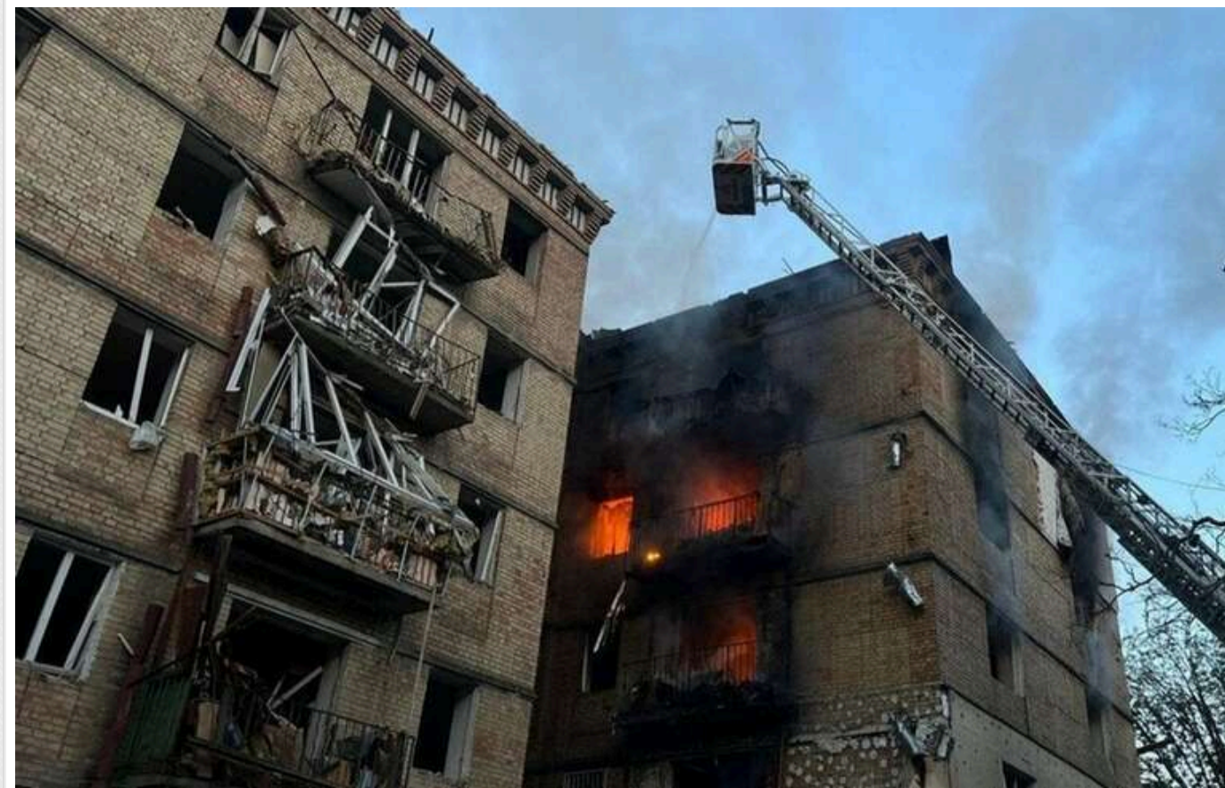
Одна ніч обійшлася у 53 мільйони: скільки Київ і держава витратять на допомогу постраждалим від атаки 17 червня

Читати на руском Read in English Додати як бажане джерело в Google