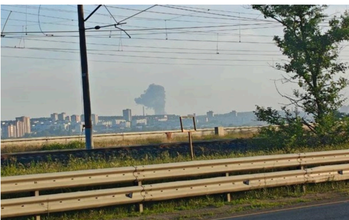
У Тольятті після атаки БПЛА сталася пожежа

Місцеві жителі діляться кадрами проліту БПЛА і великої пожежі. За попередніми даними, дрони вдруге атакували Тольяттікаучук.