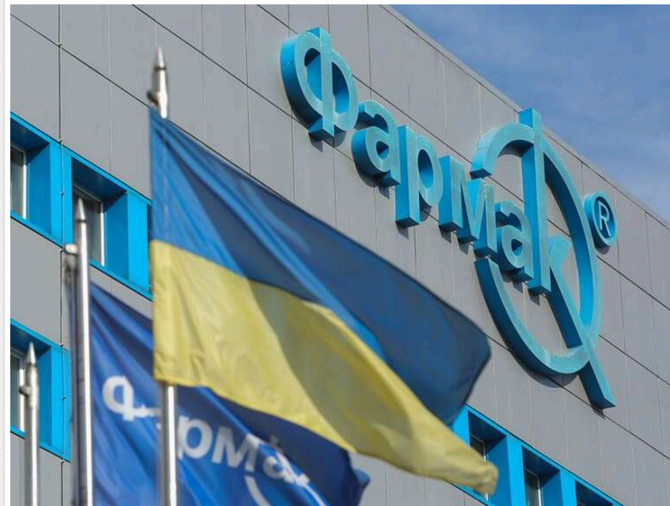
«Фармак» під підозрою у змові з дистриб'юторами: завдано збитків державі на понад 3 мільйони гривень

Йдеться про схему, яка дозволяла продавати лікарські засоби в державні та комунальні установи за завищеними цінами. За цим фактом порушено кримінальне провадження за статтями 191 і 209 Кримінального кодексу України – привласнення майна у великих розмірах та його легалізацію шляхом відмивання коштів.