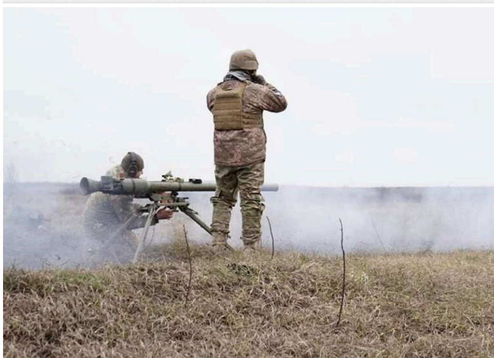
Росіяни намагалися прорватися в тил ЗСУ через газову трубу – атаку зірвано

Противник укотре спробував використати нестандартні шляхи та швидкісну техніку для проникнення в тил українських позицій, однак зіткнувся з підготовленою обороною.