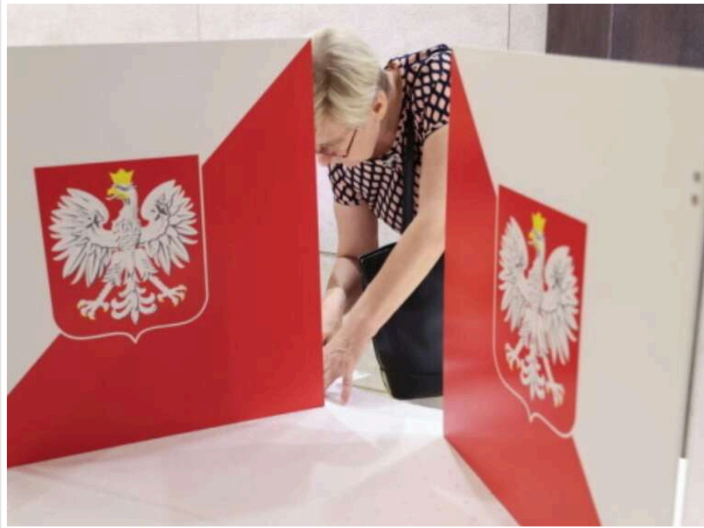
У Польщі подано понад 3 тисячі скарг на результати президентських виборів: можливий перерахунок голосів

Читати на русском Додати як бажане джерело в Google