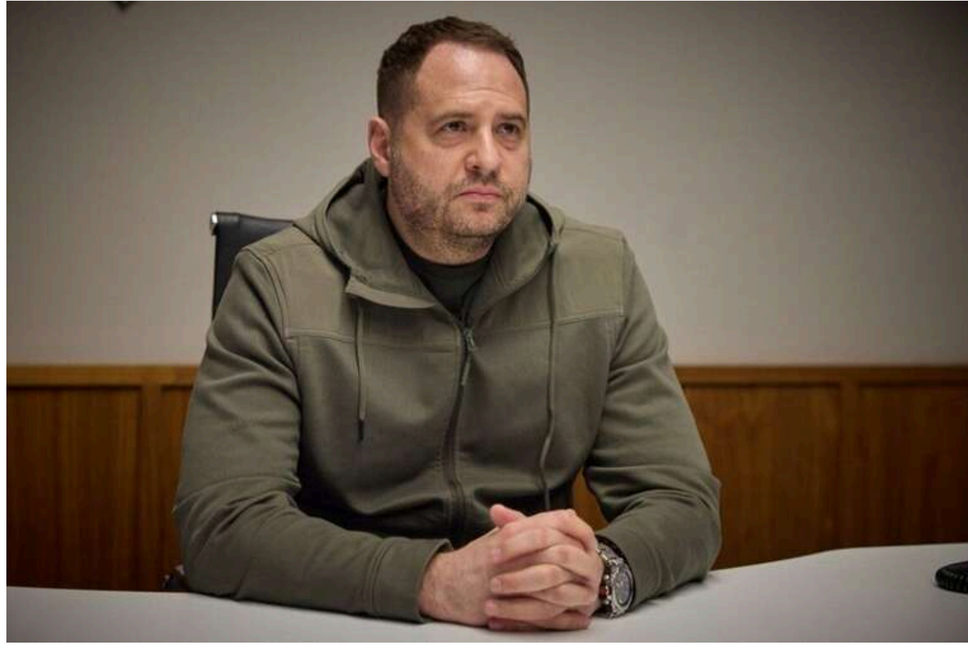
"Боляче": Єрмак про атаку на Київ і байдужість світу до терору РФ проти цивільних

Керівник Офісу президента України Андрій Єрмак після атаки 17 червня заявив, що Росія продовжує війну з цивільними. Він підкреслив, що РФ після терору, який вона влаштовує в Україні, не отримує необхідної реакції від цивілізованого світу. 17 червня у столиці після чергового жакливого удару відомо про понад сотню поранених та 15 загиблих.