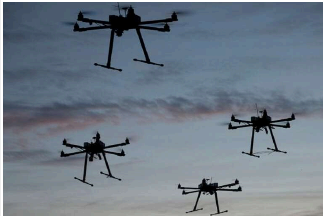
Масована атака дронів на Херсон: щонайменше 14 поранених у Дніпровському районі

Читати на русском Read in English Додати як бажане джерело в Google