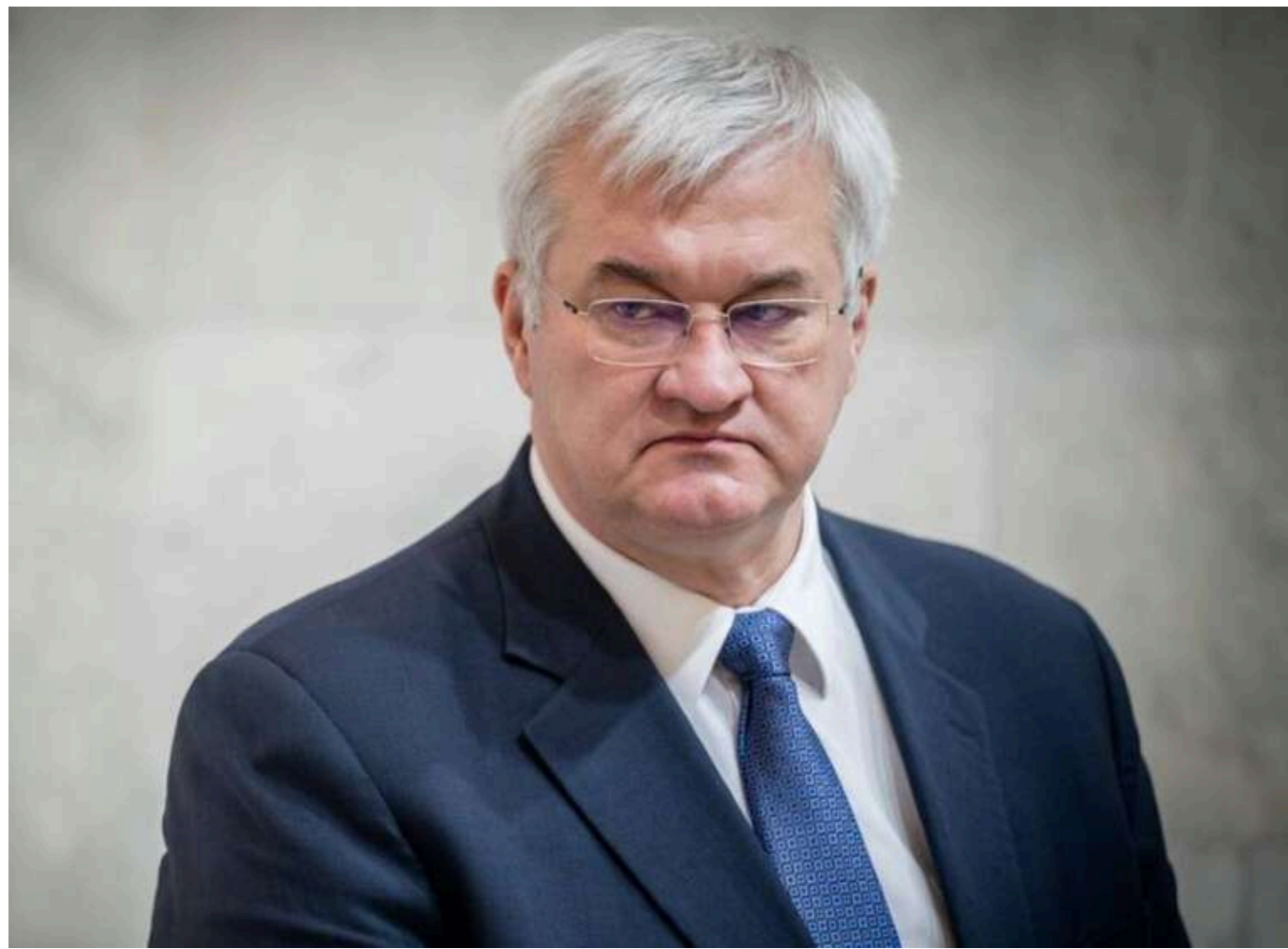
Путін хоче змусити лідерів G7 виглядати слабкими, - Сибіга

Напавши на Україну перед останнім днем саміту G7 в Канаді, лідер РФ Володимир Путін подає сигнал зневаги та прагне зробити так, щоб лідери виглядали слабкими.