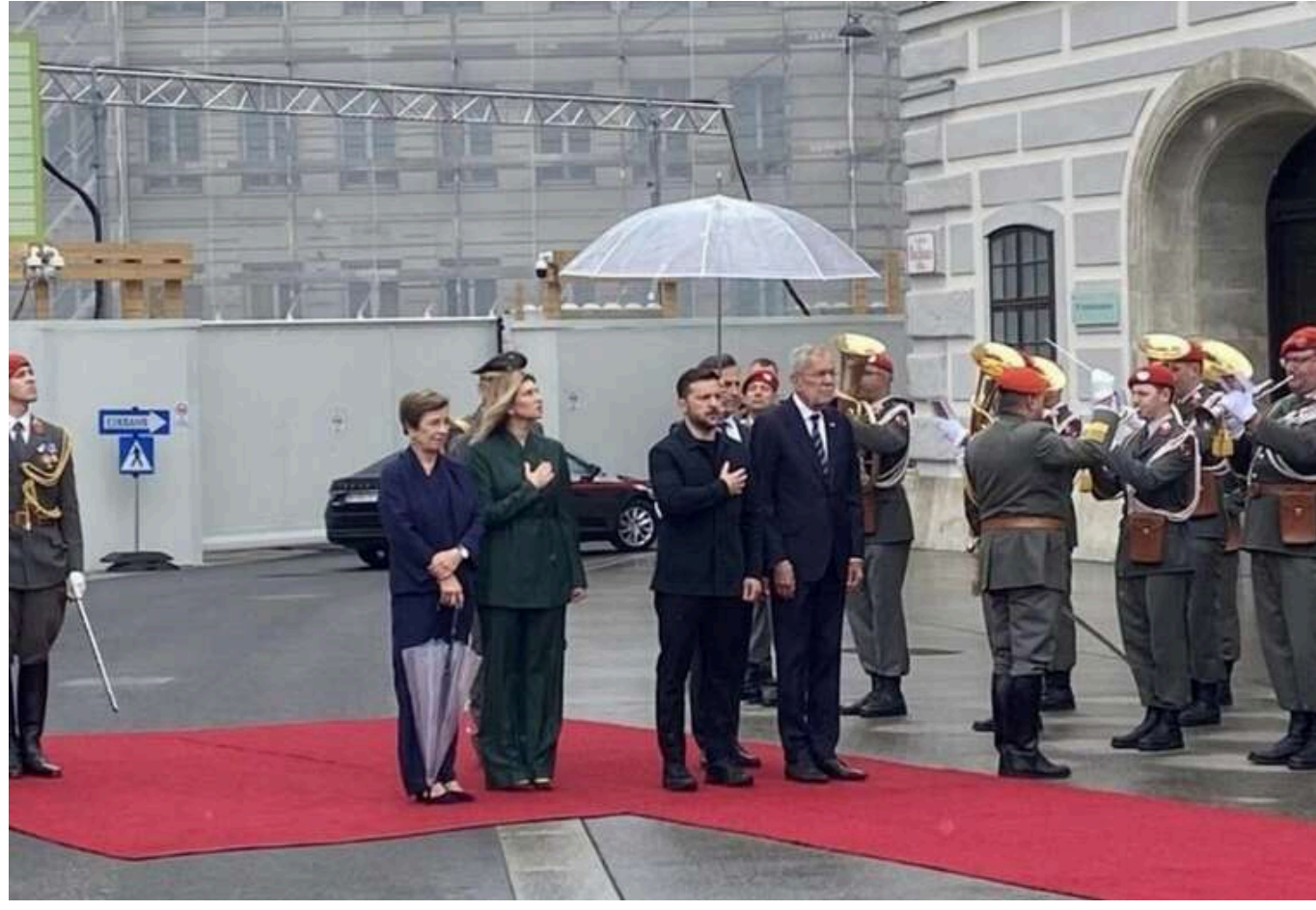
Зеленський у Відні "залишив дружину під дощем", - ЗМІ

Австрійське видання Heute повідомило, що президент України Володимир Зеленський, на їхню думку, "допустив недогляд" під час зустрічі з австрійським колегою Александром Ван дер Белленом у Відні.