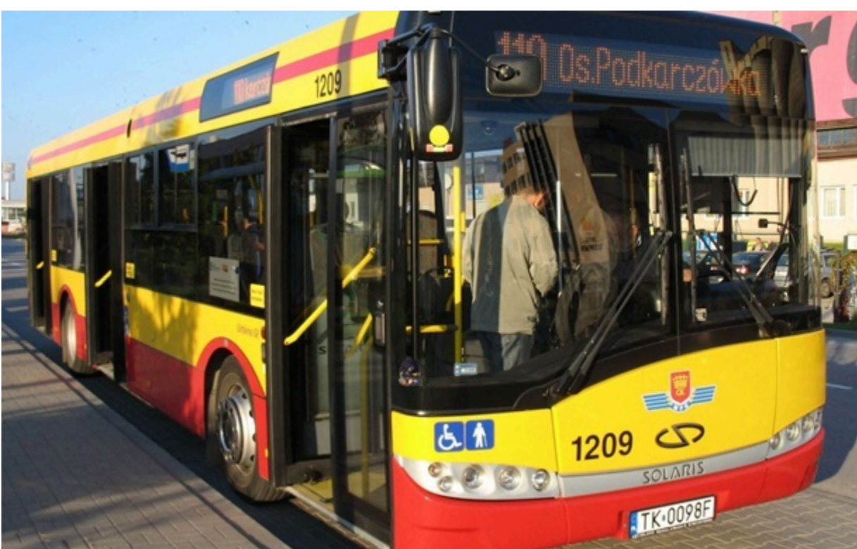
Старі автобуси до політичного скандалу Вінниці мали передати безкоштовно

Вживані 17-річні автобуси влада Кельце мала передати українському місту-побратиму безкоштовно. Однак місцеві праві депутати почали вимагати від Вінниці перейменувати вулицю Бандери, "аби по ній не їздили польські автобуси".