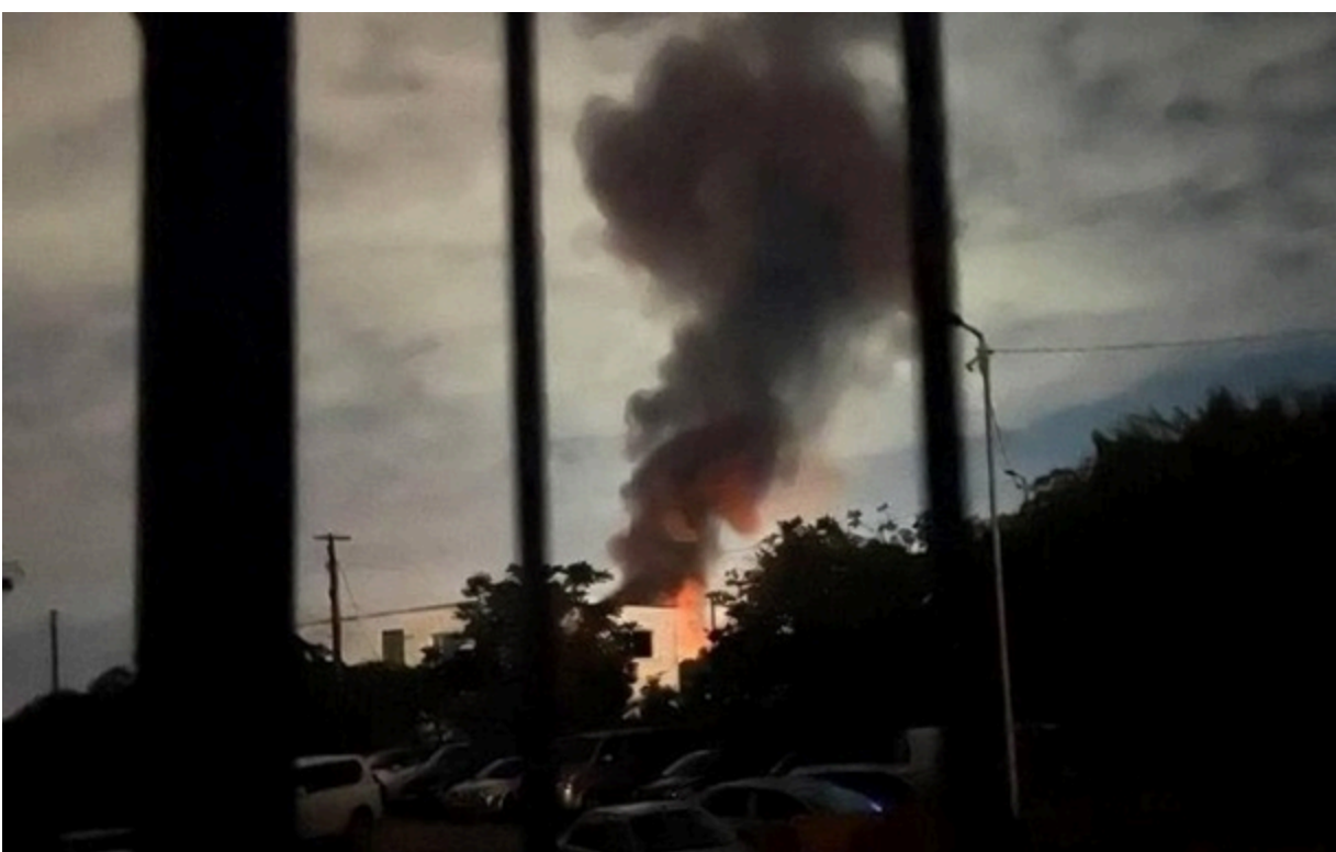
У Сімферополі повідомляють про пожежу на ТЕЦ

Місцеві жителі діляться кадрами з наслідками "прильоту" і повідомляють про перебої зі світлом.