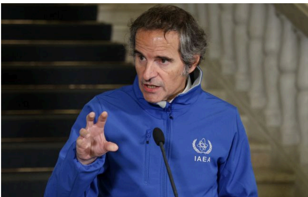
Фото: очільник МАГАТЕ Рафаель Гроссі