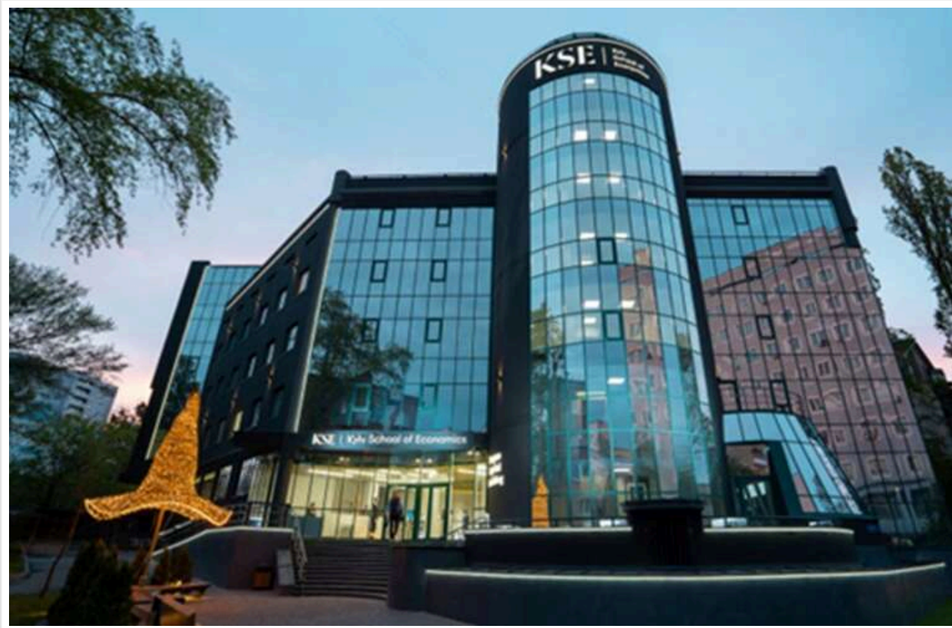
Освіта або схема: Милованова звинувачують у незаконних планах будівництва кампусу KSE в Оболонському парку

Читати на руськом Read in English Додати як бажане джерело в Google