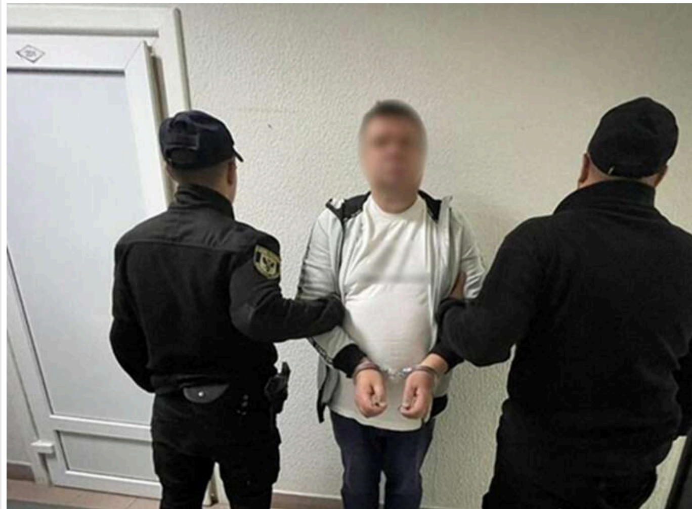
На Чернігівщині затримали двох підозрюваних у шахрайстві: заволоділи квартирами померлих на 2 мільйони гривень

Читати на руском Read in English Додати як бажане джерело в Google