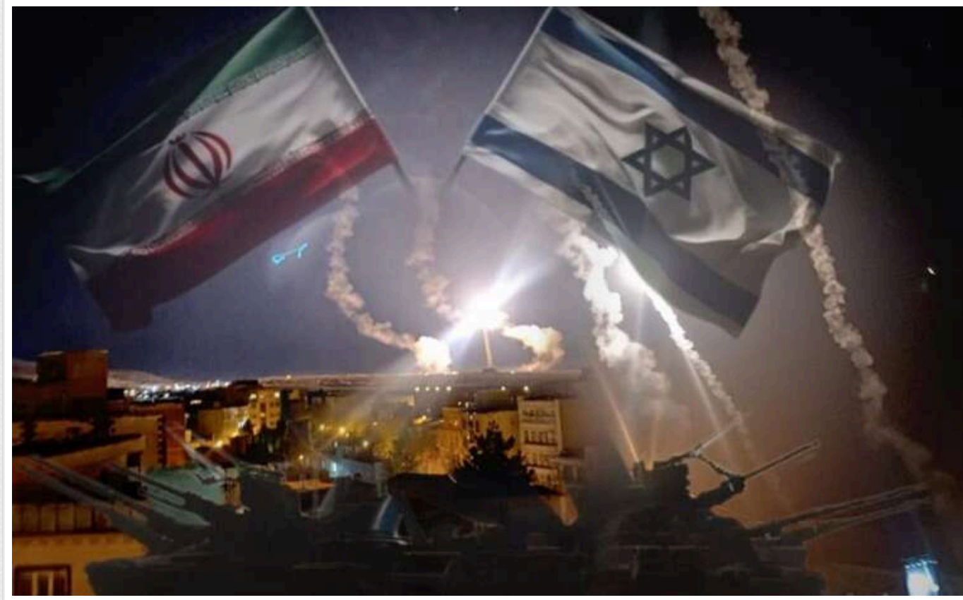
Іран мав конкретний план знищити Ізраїль, - ЦАХАЛ

ЦАХАЛ зібрав і проаналізував чимало розвідувальних даних, що свідчать про існування в Ірану конкретного плану щодо знищення Ізраїлю.