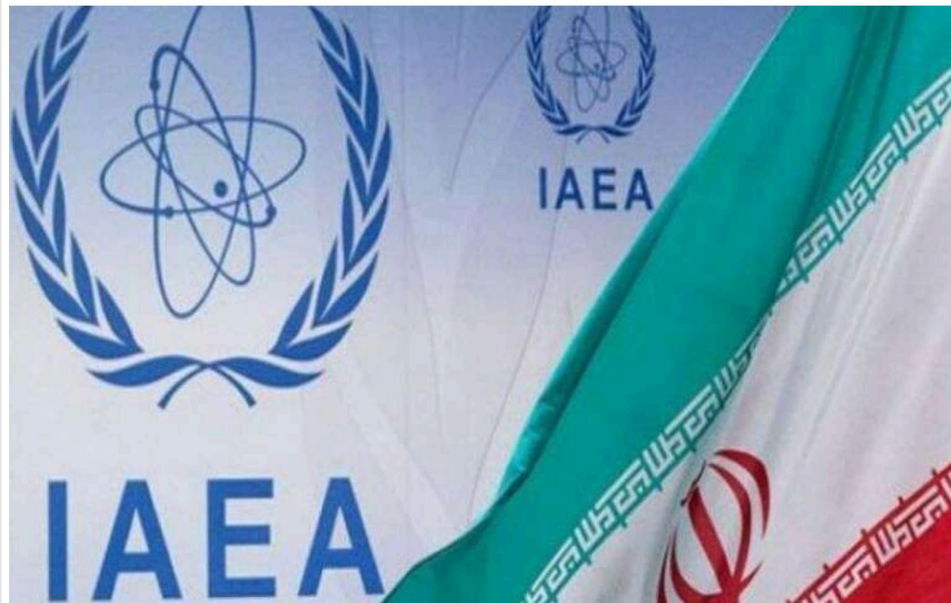
МАГАТЕ звинуватило Іран у порушенні своїх ядерних зобов'язань

Вперше за майже два десятиліття Рада керуючих Міжнародного агентства з атомної енергії (МАГАТЕ) схвалила резолюцію, в якій стверджується, що Іран протягом довгих років не дотримується зобов'язань щодо перевірок своєї ядерної програми.