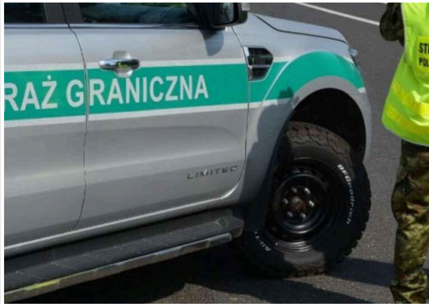
Українця депортували з Польщі за напад на медсестру: заборонили в'їзд до Шенгенської зони на 5 років

Читати на руськом Read in English Додати як бажане джерело в Google