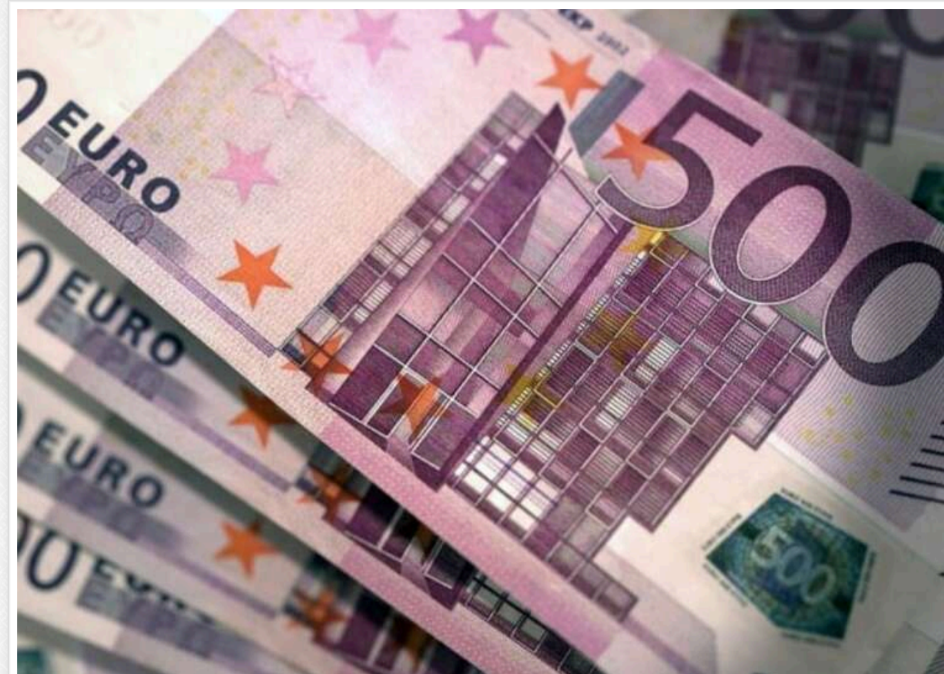
Офіційний курс євро вперше досяг позначки 48 гривень