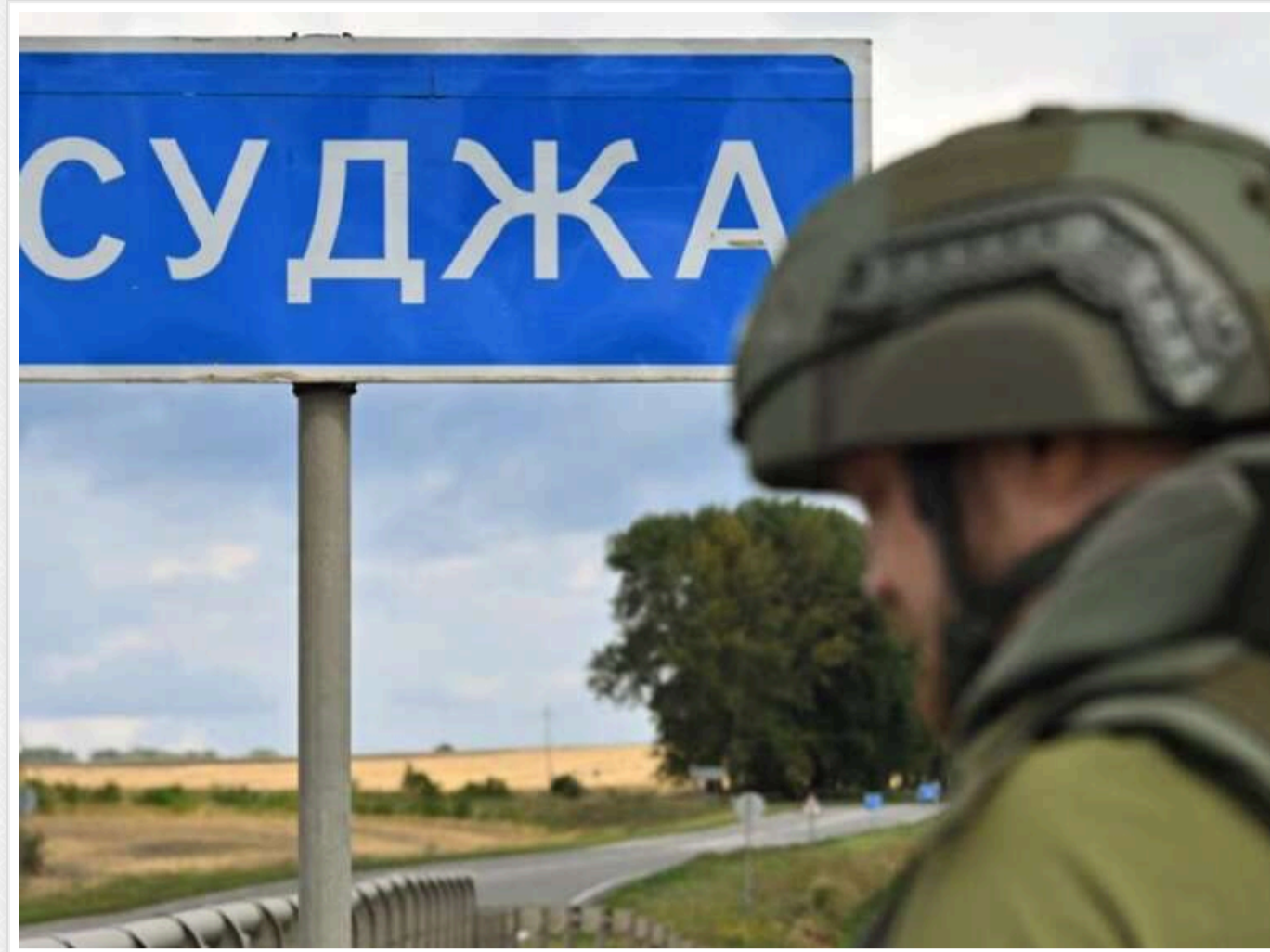
Атаки ЗСУ в Курській області не принесли бажаного результату

Читати на руском Read in English Додати як бажане джерело в Google