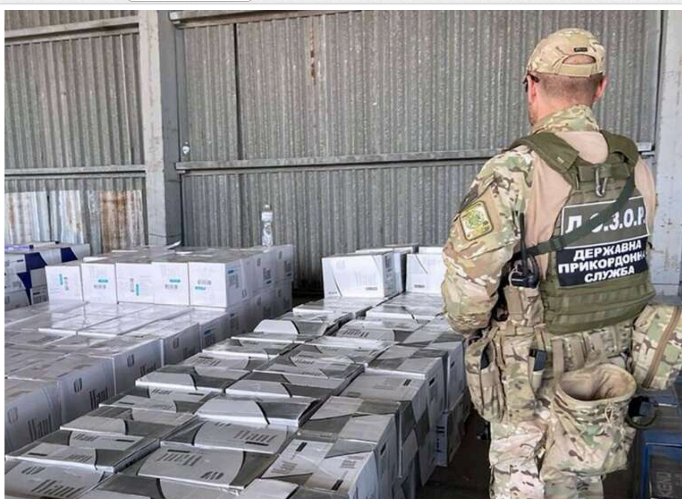
Криміналізація товарної контрабанди в Україні: нульовий результат і мільярди втрати бюджету

Півтора року тому Україна криміналізувала товарну контрабанду, через яку бюджет втрачає мільярди доларів.